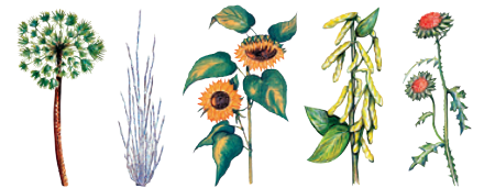
自然塗料オスモカラー