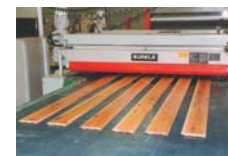
ブラッシングマシンによる刷り込み工程