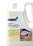
〈オスモウォッシュアンドケア〉

●ダストモップ(グリーン) 床の埃を拾います ●アクティブファイバー布 ワックスアンドクリーナー塗布用