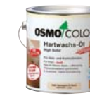
〈オスモカラー フロアーグリアーシリーズ〉