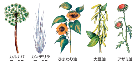
自然塗料オスモカラー