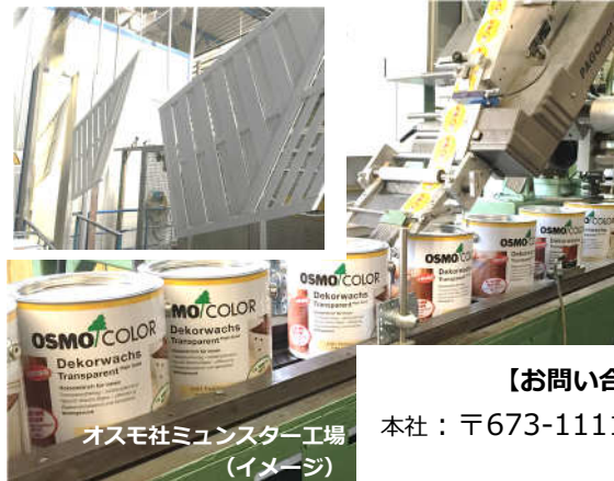
オスモ社ミュンスター工場 (イメージ)