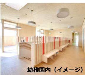
幼稚園内 (イメージ)