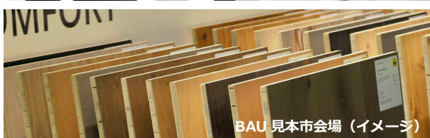
BAU 見本市会場 (イメージ)