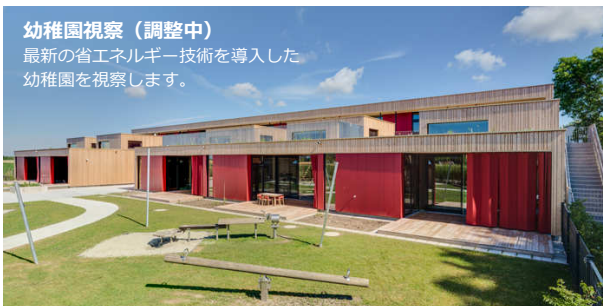
幼稚園視察 (調整中) 最新の省エネルギー技術を導入した幼稚園を視察します。

世界屈指の建材フェア。前回(2015年)は50年に渡る歴史で初めて来場者が25万人を突破。18万㎡を超える広い展示会場にはドイツのみならず、ヨーロッパ、そして世界をリードする企業が一堂に会します。