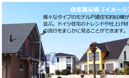
住宅展示場 (イメージ)

様々なタイプのモデル戸建住宅約60棟が並び、ドイツ住宅のトレンドや仕上げ材の流行をまじかに見ることができます。