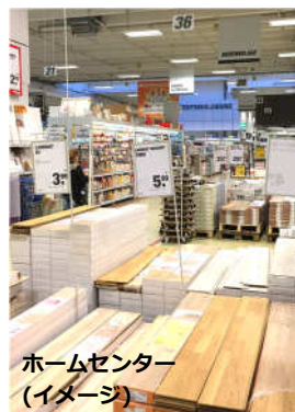
ホームセンター (イメージ)