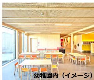
幼稚園内 (イメージ)

100年以上に渡るBMW社の技術の発展を歴史やコンセプト別に展示。往年の名車も多く展示されています。