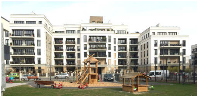
省エネ設計建築視察 (調整中) 省エネ技術、エネルギー効率化を導入した建築物を視察します。*写真はイメージです。実際に視察する建物とは異なります。