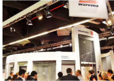
フェンスターバウ視察(イメージ)