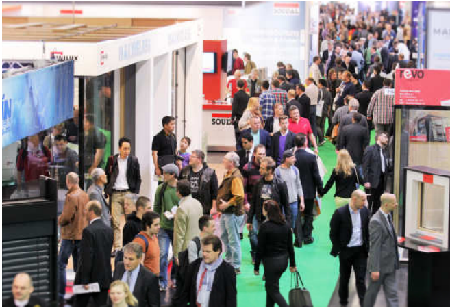
フェンスターバウ会場 来場者数:110,000人、出展社数:1,296社 (2016年実績)