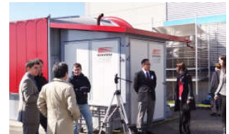
ヴァレーマ本社 必要な樹脂部品、制御システムまで自社で開発、製造する徹底した品質管理を行っています。