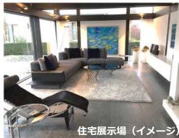
住宅展示場 (イメージ)