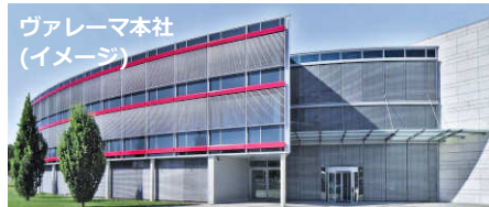
ヴァレーマ本社 (イメージ)