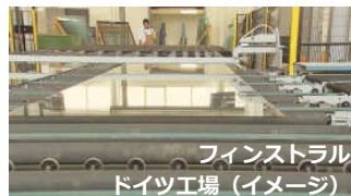
フィンストラル社 ドイツ工場 (イメージ)